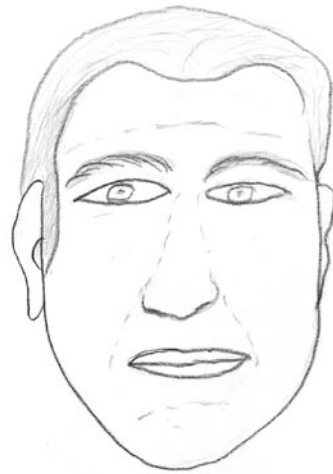
Rozdíl v kreslení před a po kurzu jsou obrovské...